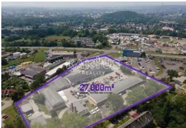
ILUSTRÁČNÍ MAPA AREÁLU - NÁJEMCI