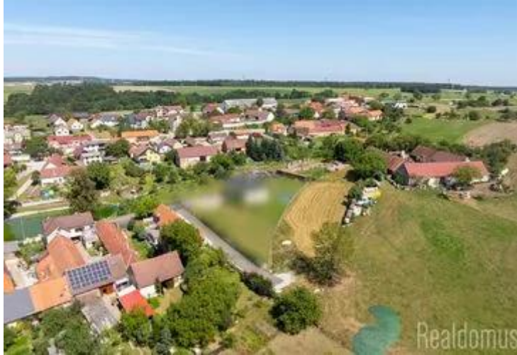
Územní plán, k.ú. Lišov, obec Lhotice